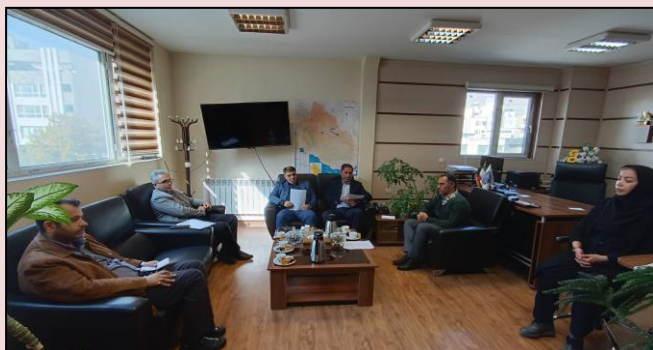
نشست هشتم کارگروه استانی دفاتر پیشخوان خدمات دولت و دفاتر ارتباطات و فناوری اطلاعات روستایی