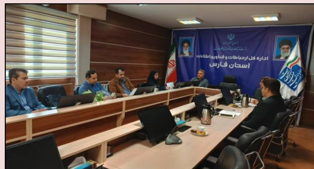
نشست چهارم و پنجم کمیته استانی نظارت بر ایفای تعهدات دارنده پروانه و اعمال مقررات