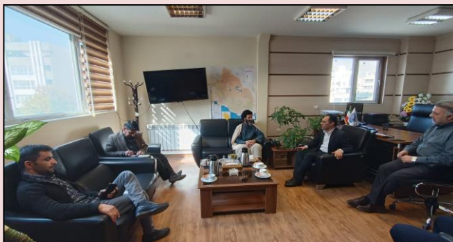
بررسی پوشش ارتباطی روستای امیرسالار بخش میمند با حضور امام جمعه و رئیس شورای روستا