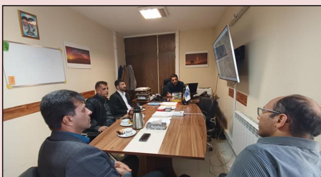
ملاقات و تکریم ارباب رجوع