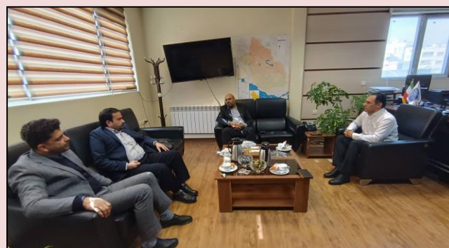
جلسه هماهنگی با کارشناسان حوزه افتا