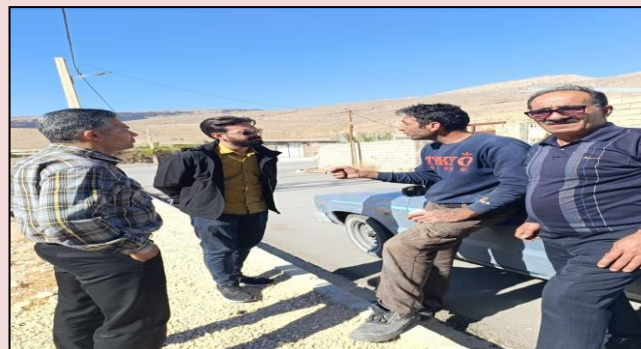
بررسی پوشش ارتباطی روستای آب جهان شهرستان داراب