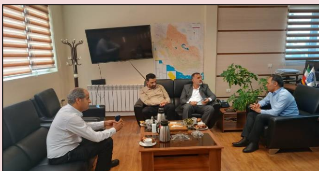
جلسه با فرماندار شهرستان خفر جهت پیگیری اجرای فیبرنوری منازل و کسب و کارها در شهرهای باب انار و خاوران شهرستان خفر