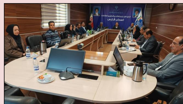
شرکت ویدیو کنفرانسی مسئولان فناوری اطلاعات دستگاههای اجرایی استان فارس در همایش تحول دیجیتال با حضور وزیر ارتباطات و معاون رئیس جمهور